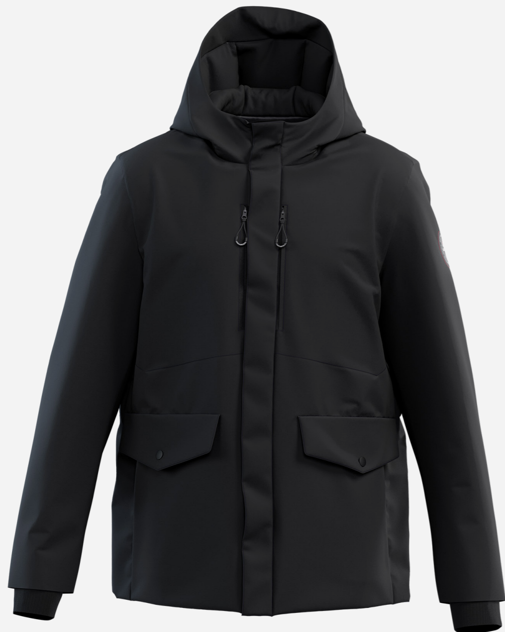
22 6420 EDWARD

Field jacket c/cappuccio staccabile. Piuma 90/10. Interno silver heat reflection 6 tasche. Polsini interni in costina. Tessuto stretch con membrana wr e antivento.